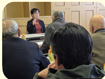
農業者との意見交換会（山形市）