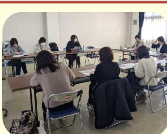
女性農業者との意見交換会（天童市）