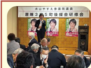
舟山やすえ置賜3市5町後援会研修会