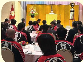
長井消防団「日本消防協会特別表彰受賞記念祝賀会」