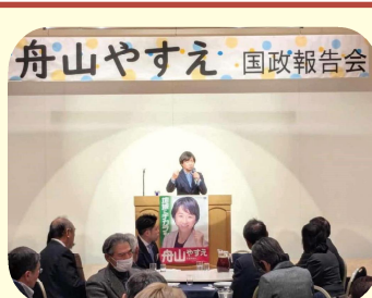
舟山やすえ酒田飽海後援会国政報告会