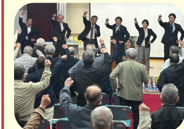
はが道也国政報告会（川西町）