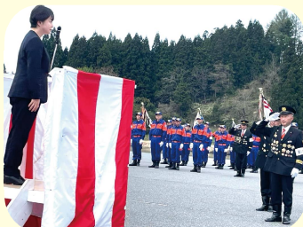
舟形町春季消防演習