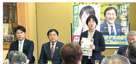
3人合同で国政報告会