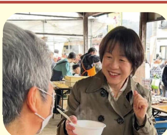
梨郷地区朝市（南陽市）