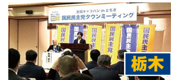
全国キャラバンinとちぎ