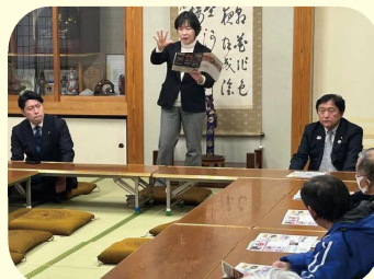
国政報告会（寒河江市）