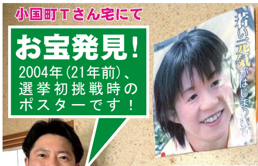
小国町Tさん宅にて お宝発見！ 2004年（21年前）、選挙初挑戦時のポスターです！