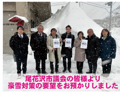
尾花沢市議会の皆様より豪雪対策の要望をお預かりしました