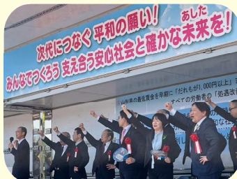
山形県中央メーデー