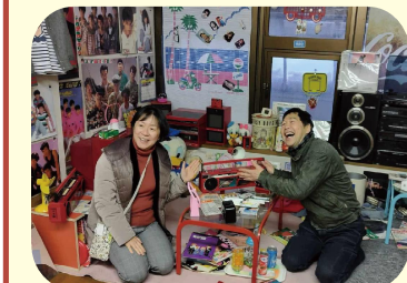
昭和サブカルチャーセンター（鶴岡市）