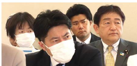
「国民民主党政務調査会」連日開催される朝の部会での一コマ