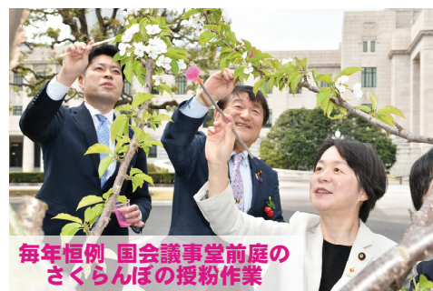
毎年恒例 国会議事堂前庭のさくらんぼの授粉作業