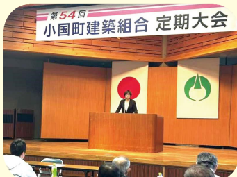
小国町建築組合定期大会