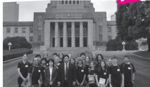
▲ニュージーランドの高校生の皆さんと。

お知らせ インターネットテレビ みわちゃんねる 突撃永田町!! http://loxx.tv/nagatacho/index.html