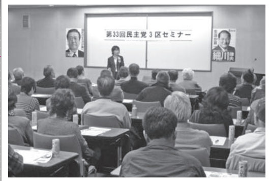
越谷市選出の細川律夫衆議院議員主催のセミナーにて。