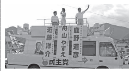
▶▶8月20日 ダッシュ号・街宣活動