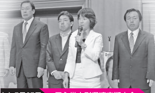
▶▶7月27日 民主党山形県連定期大会