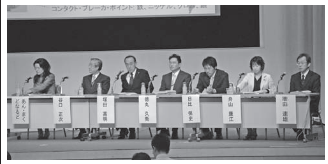
農林水産業・農山漁村と生物多様性について講演。