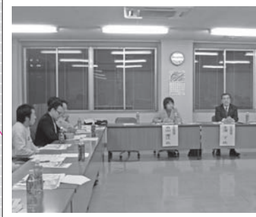
▶▶12月13日 JA庄内たがわ青年部 榎引支部との農政懇談会