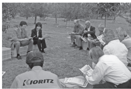
▶▶10月17日 長野市にてリンゴ農家との青空座談会