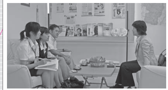
山形大学の学生さんと山形事務所にて。